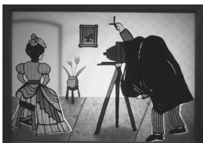
影絵紙芝居「よこはまものがたり」